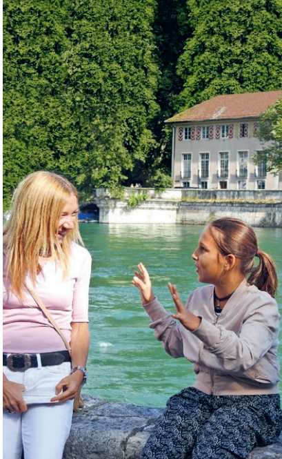
Eine Stadtführung der anderen Art.